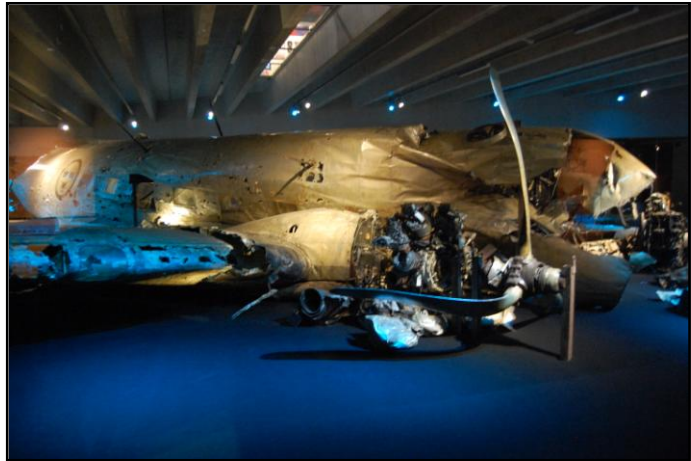
Den "riktiga" DC 3an.

Efter lunchen fick Vi en guidad tur runt i museet, med början på tidigt 1900 tal fram till våra dagar. En mycket bra redogörelse, de olika tidsepokernas flyg inom militär o spaningsflyg. Det mest intressanta var väl DC3-an som tagits upp från Östersjöns botten efter att ha skjutits ner av Främmande makt.